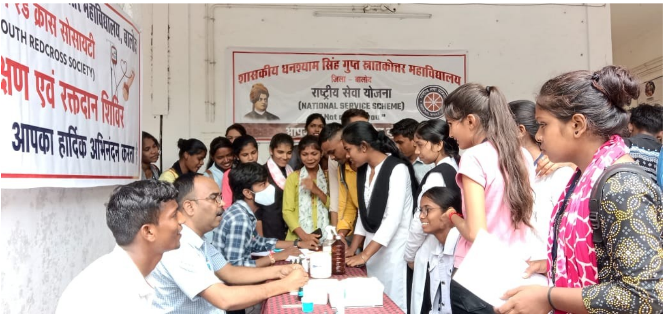
जिला स्तरीय रक्तदान शिविर