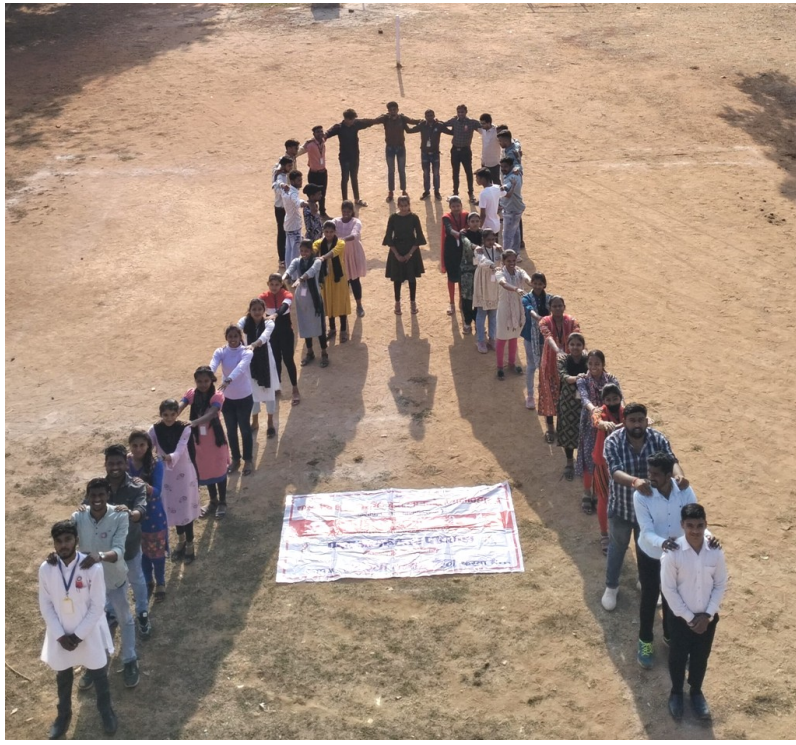
एड्स दिवस मानव श्रृंखला