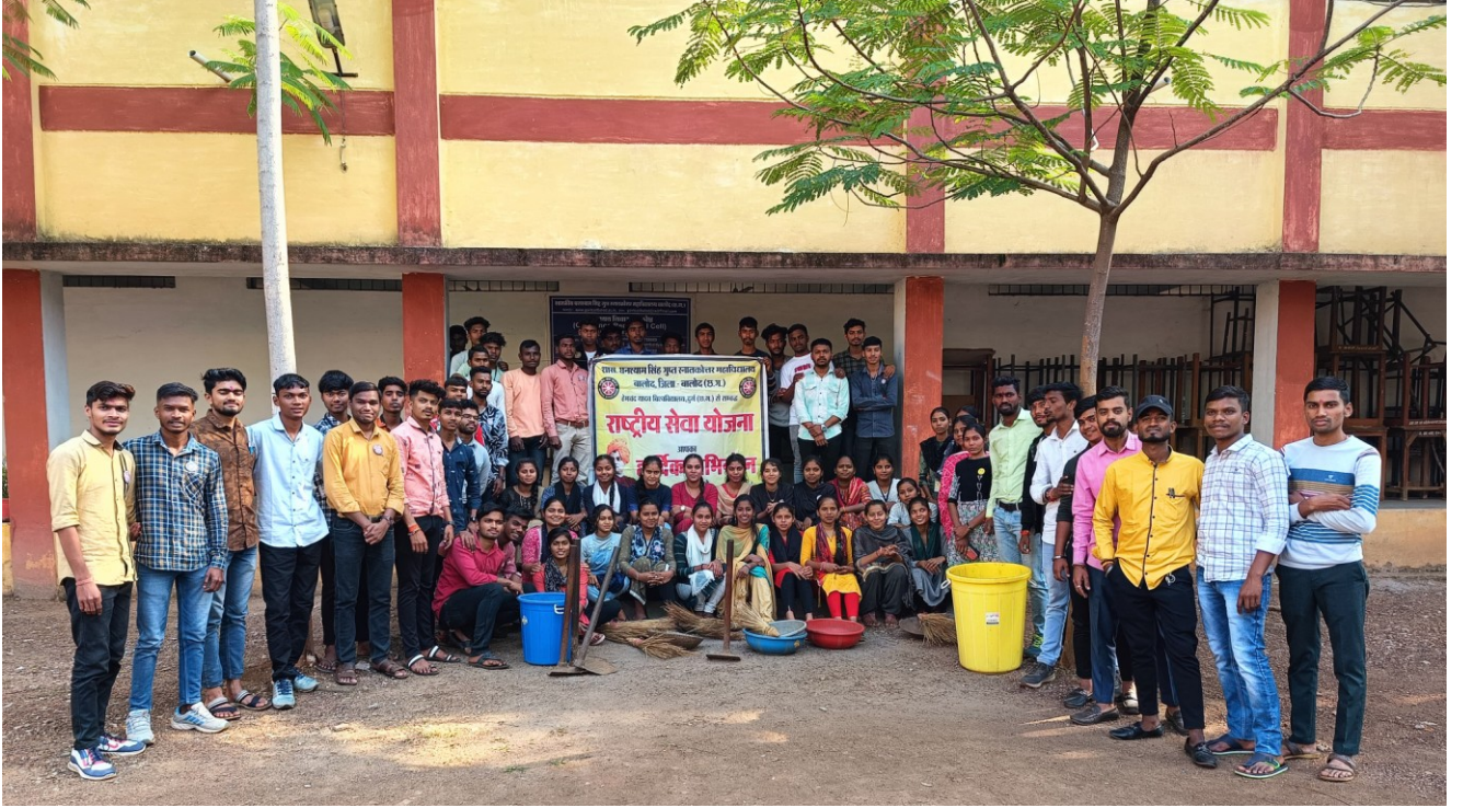
रासेयो स्वयंसेवको द्वारा महाविद्यालय में स्वच्छता कार्य