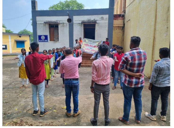
स्वच्छता संकल्प रासेयो महाविद्यालय बालोद